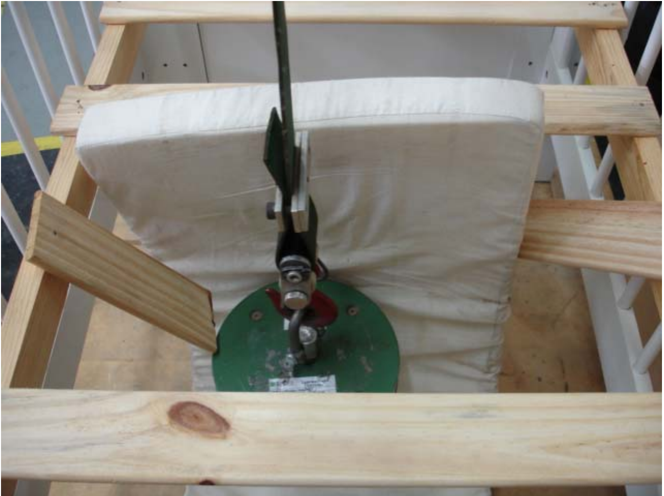
Foto 06: Esta foto mostra um estrado quebrado porque não resistiu ao ensaio de resistência. Ou seja, esse berço foi considerado não conforme porque o estrado rompeu.