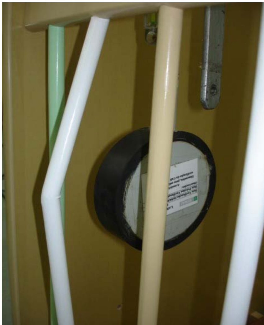
Foto 07: Esta foto mostra uma barra da grade lateral do berço que quebrou quando foi aplicada a força de impacto.