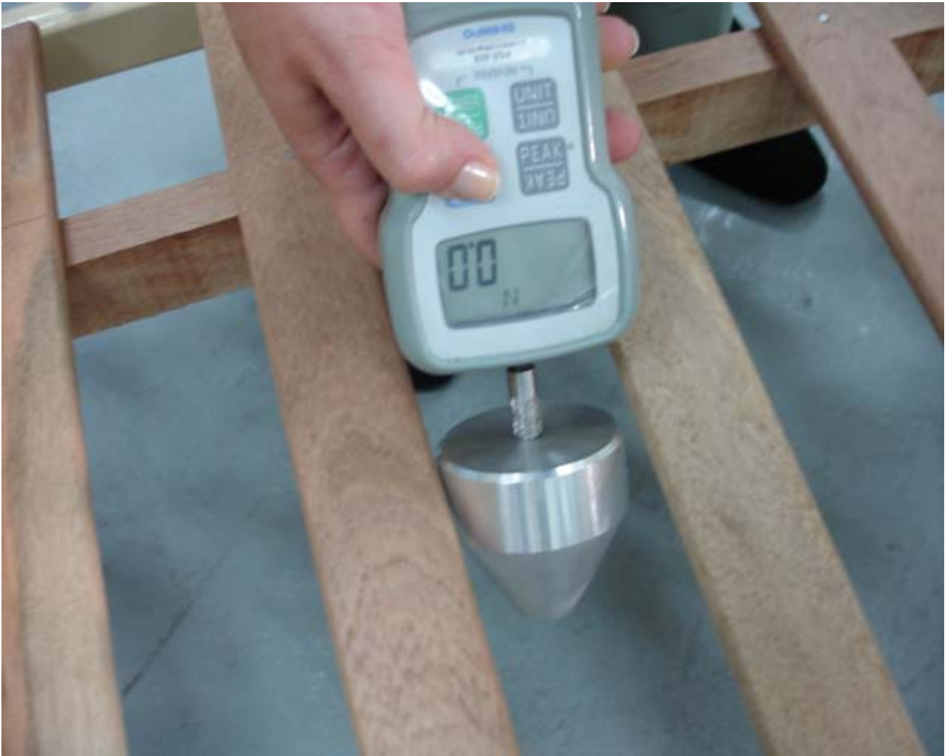
Foto 02: O espaçamento não deve permitir que o instrumento de medição passe pelos espaços entre o estrado do berço, mesmo quando é empurrado com força. No caso mostrado na foto, o estrado não está de acordo com a norma, pois o cone, que simula a perna e o braço do bebê, passa pelas ripas do estrado.