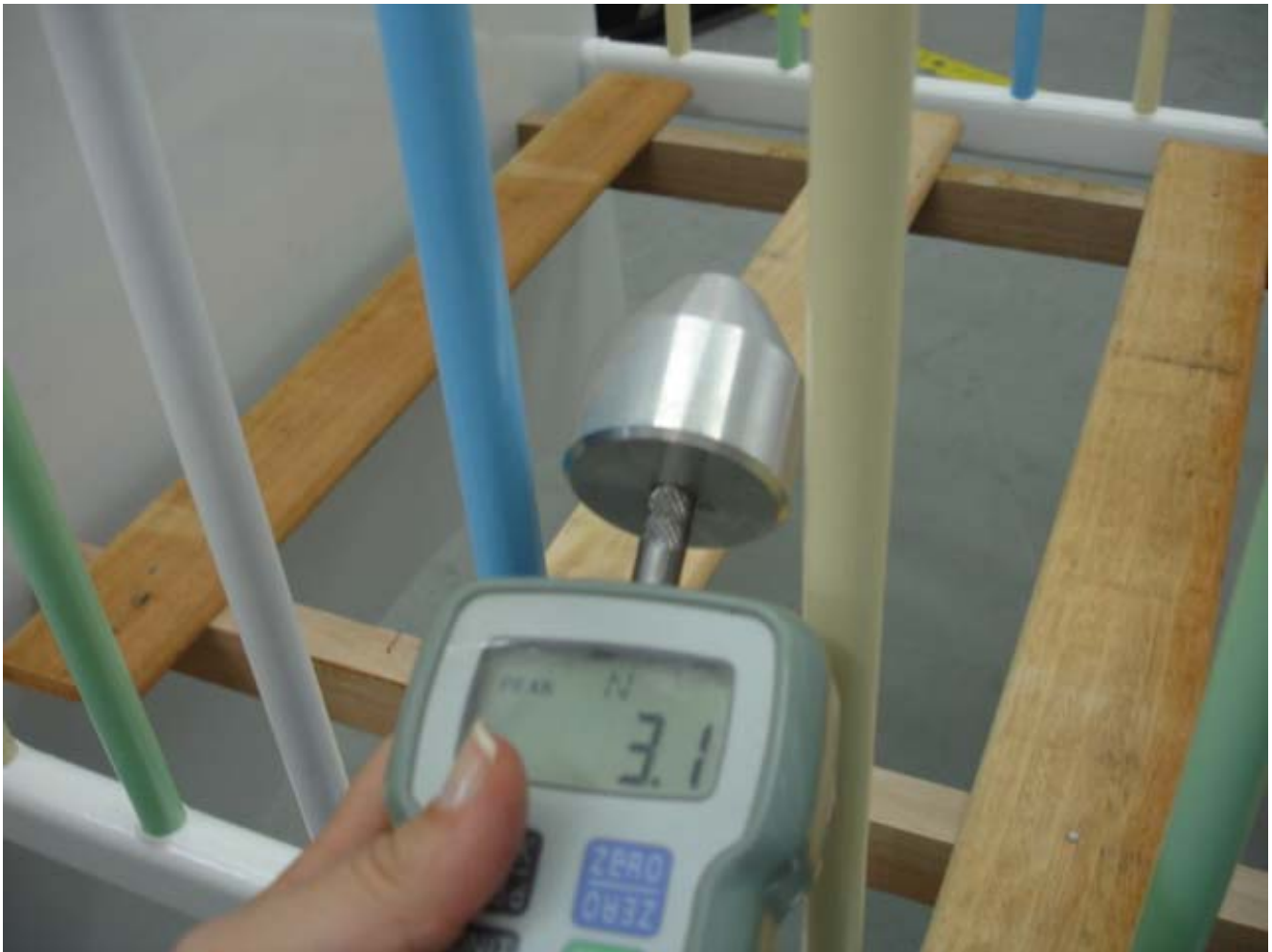
Foto 03: O espaçamento entre as ripas da grade lateral não deveria permitir que o cone com 6,5 cm de diâmetro passasse entre elas. Nesse caso da foto, o berço não atende à norma e coloca em risco o bebê.