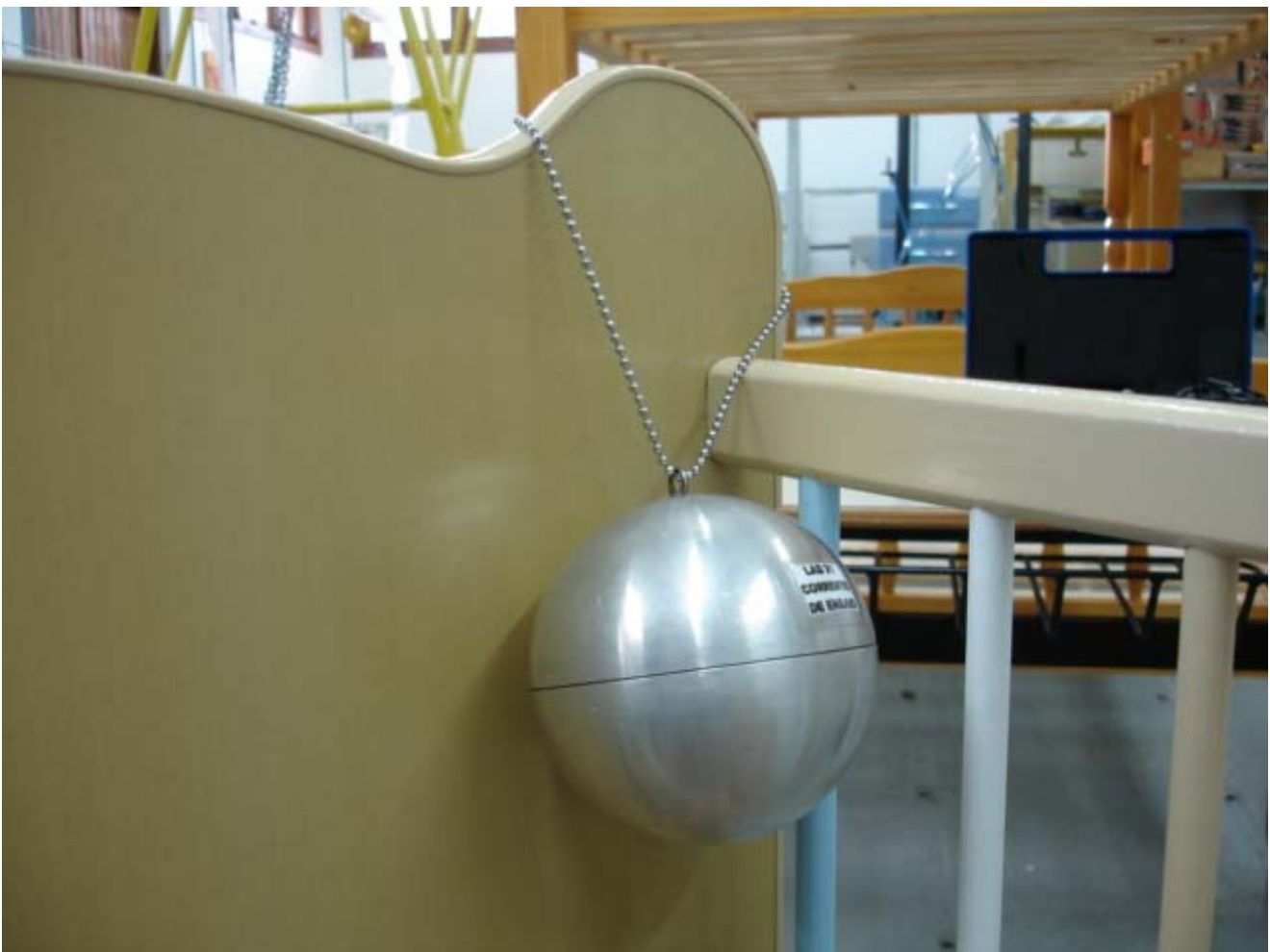
Foto 04: Se os equipamentos ficarem presos no berço, significa que o bebê pode ficar preso também, com risco de estrangulamento ou ferimentos.

Para verificar se o bebê pode ficar preso no berço, são ensaiadas duas situações: uma simula o bebê com a chupeta pendurada em volta do pescoço. A chupeta não poderá ficar presa em nenhuma parte do berço. A outra situação simula a roupa ou qualquer outro apetrecho que fique em volta do pescoço do bebê, que não deve ficar preso também em nenhuma parte do berço. A esfera apresentada na foto abaixo simula a cabeça do bebê.