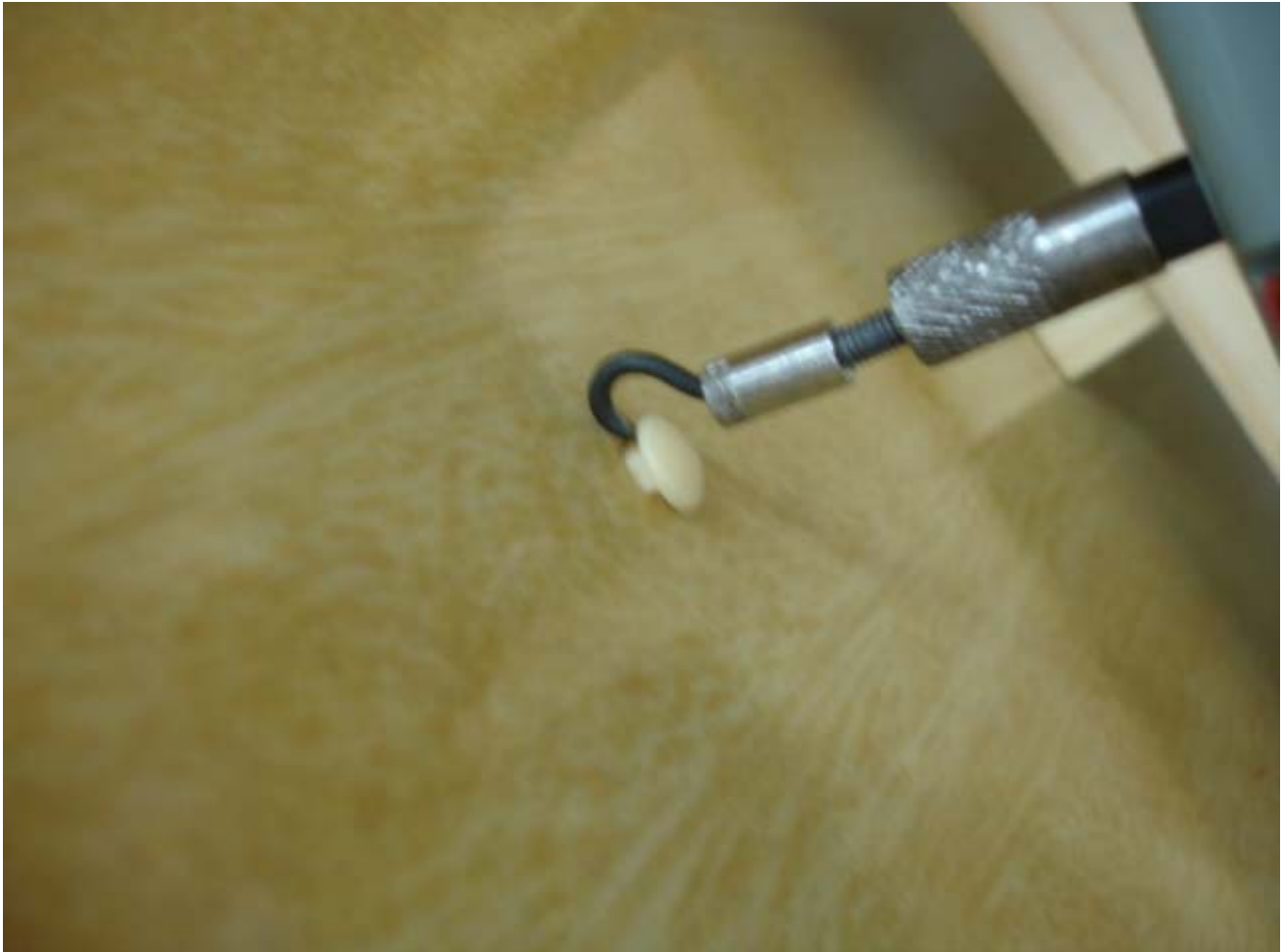
Foto 05: Mostra uma parte destacável sendo retirada do berço. Esse berço foi considerado não conforme porque a peça, sendo retirada por uma criança, poderia ser engolida.

Resultado: Das 11 marcas analisadas, 05 apresentaram-se não conformes (45%): A, D, H, I e J.