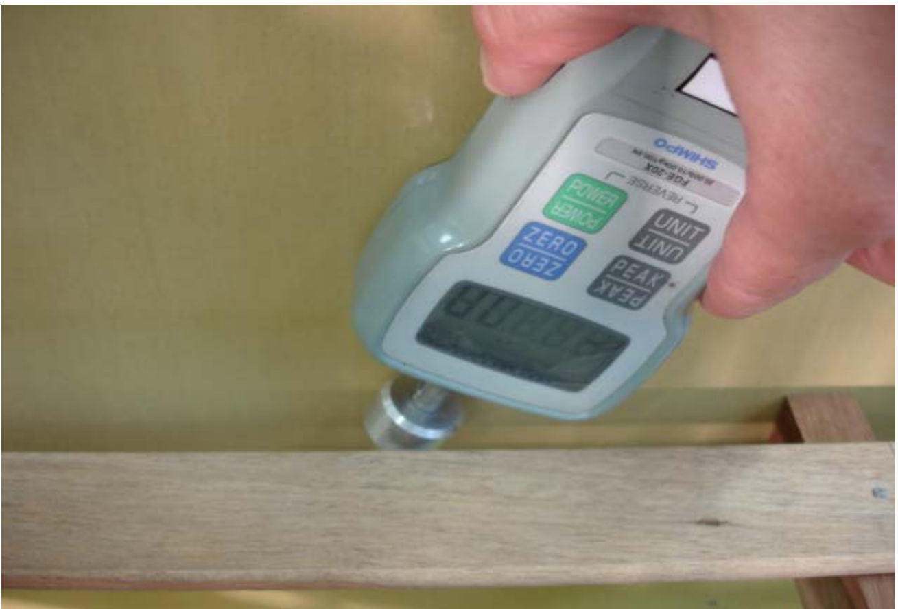
Foto 01: mostra a medição da distância entre a cabeceira e a ripa do estrado.